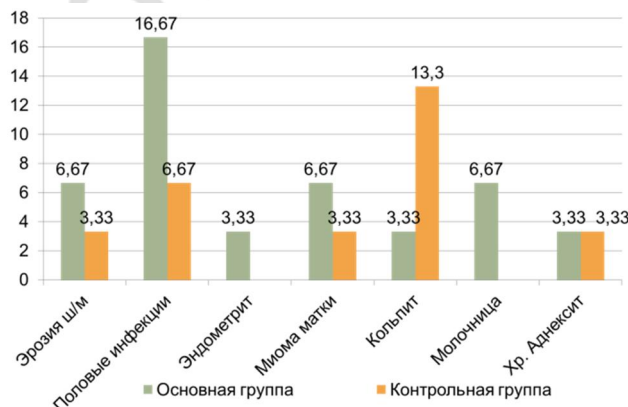
Рис. 2 - Гинекологические заболевания, %