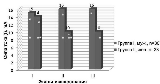
Рис. 1. Порог болевой чувствительности у пациентов I и II групп, сформированных по гендерному признаку. * - U-test: U = 159; P < 0,01 ; ** - T-test: T = 40; P < 0,01 .

Результаты и обсуждение. При сравнительном анализе по гендерному признаку было выявлено, что сила тока ( Me[25; 75] ), действие которого расценивалась пациентами как, боль на уровне 60 баллов по ВАШ на I этапе составила у мужчин (N = 30) 15[14; 16] мкА, а у женщин (N = 33) – 14[13; 14] мкА ( U = 159; P < 0,001 ). На II этапе: I_{\text{муж}} = 16[15; 16] мкА,