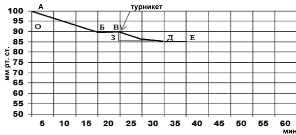
Рис. 1. Эдемометрограмма здорового мужчины 22 лет. Пояснение в тексте

к диастолическому артериальному давлению, индекс притока-оттока (ИПО – отношение ВЗ к ЗД эдемометрограммы), снижение давления после ИМЦД (СдПИМЦД, интервал ВД), продолжительность снижения давления после ИМЦД (ПДСдИМЦД, интервал ЗД), тканевое давление (ТД – интервал ДЕ) и коэффициент тканевого давления (КТД – отношение ТД к ИМЦД, ДЕ/БВ) (рис. 1).