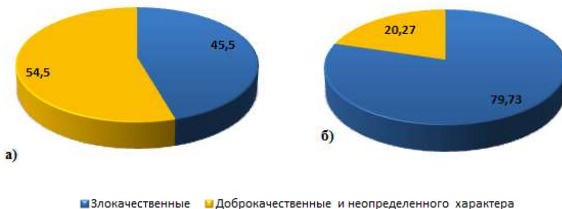
Рис. 4 Структура новообразований по ЧСН (а) и по ЧДН (б)

Около половины случаев ВН, зарегистрированных на предприятии за 2013-2015 гг. по группе «новообразования», относятся к злокачественным (45,5 %). При этом злокачественные новообразования в структуре дней ВН составляют 79,73 % от всех дней ВН по группе «новообразования» (рисунок 4).