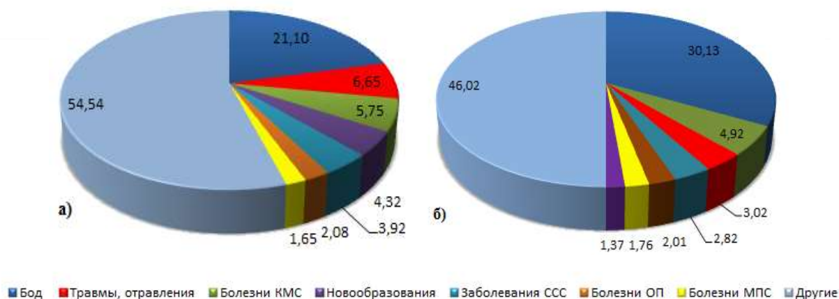
Рис. 2 Структура заболеваемости на предприятии радиоэлектронной промышленности г. Минска по среднемуголетним данным ЧДН (а) и ЧСН (б) за 2013-2015 гг.

Для исключения разнонаправленности показателей ЗВУТ по группе болезней «новообразования» на предприятии радиоэлектронной промышленности и по республике в целом был рассчитан среднемуголетний интегральный показатель (коэффициент Розенфельда) (таблица 1).