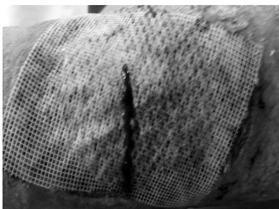
Рис. 3. Внешний вид через 2-е суток после аутодермопластики