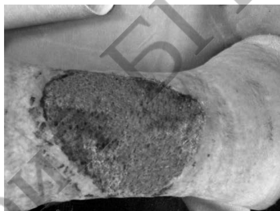
Рис. 4. Внешний вид на 10-е сутки аутодермопластики

Фибрилляция предсердий, пароксизмальная форма, N_{IIa-b} . Артериальная гипертензия 2 ст, риск 4.