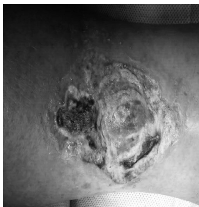
Рис. 1. Внешний вид трофической язвы левой нижней конечности при поступлении