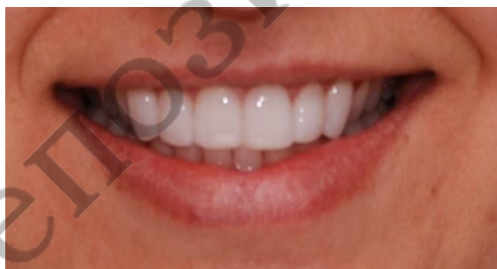
Рисунок 3 – Наиболее эстетически привлекательный клинический случай

В результате анкетирования самым эстетически привлекательным и наименее привлекательным стали одни и те же клинические случаи как для мужчин, так и для женщин.