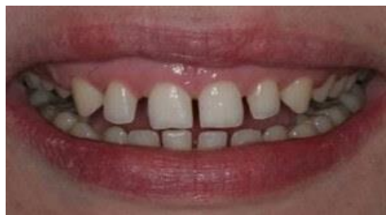
Рисунок 4 – Наименее эстетически привлекательный случай

Результаты и их обсуждение. В результате стоматологического обследования значительных изменений от принятых стандартов не выявлено, отклонения от принятой нормы по всем показателям не являются статистически достоверными. В результате анкетирования подтвердились общепринятые стандарты эстетики улыбки.