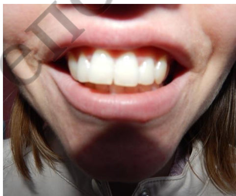
Рисунок 1 – Определение срединной линии лица

Срединная линия - воображаемая линия, проходящая вертикально через основание носа, подносовую точку, межрезцовую точку и подбородок. В идеале десневой сосочек между центральными резцами верхней челюсти располагается на срединной линии лица.