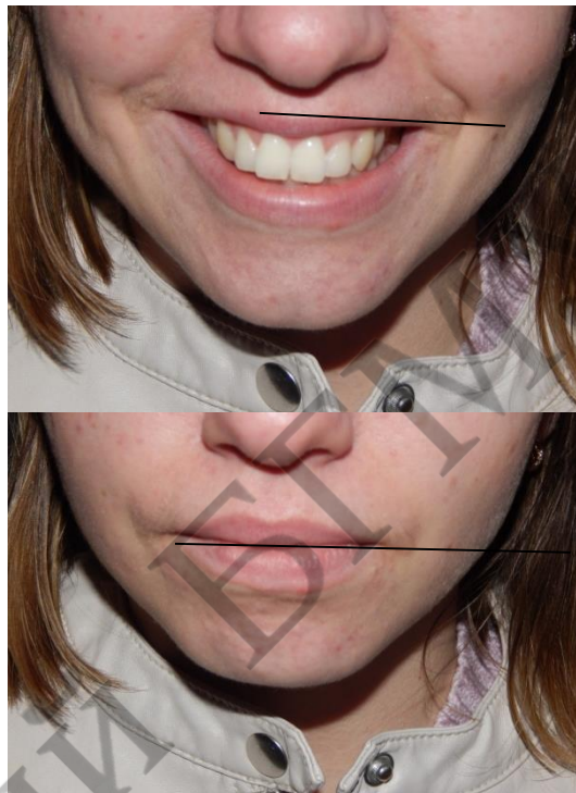
Рисунок 2 – Отношение ширины улыбки к ширине лица