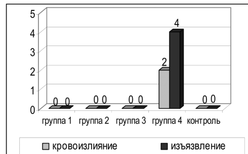
Рисунок 2. Показатели поражения слизистой желудков у крыс экспериментальных групп 1, 2, 3, 4, которым вводили р. о. в течение 1 месяца раствор субстанции низкомолекулярных пептидов, экстрагированной из листьев Taraxacum mongolicum в дозах 0,6, 0,2, 0,1 мг/кг, а также раствор ацетилсалициловой кислоты в дозе 13 мг/кг соответственно

Таким образом, на основе вышеприведенных данных можно предположить, что полученная субстанция низкомолекулярных пептидов из листьев Taraxacum mongolicum ингибирует АДФ-индуцированную агрегацию в обогащенной тромбоцитами плазме в диапазоне доз 0,1–0,6 мг/кг при введении р. о. в течение 1 месяца крысам линии SHR, причем выраженность эффекта эквивалентна эффекту, который вызывает ацетилсалициловая кислота при введе-