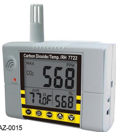
Рис. 3. Комбинированный измеритель CO 2 «Wall-mount CO 2 monitor»

Концентрация CO 2 определяется в величинах ppm (parts per million), т. е. количество частиц CO 2 на один миллион частиц воздуха (1000 ppm = 0,1 % CO 2 ). Температура воздуха и температура точки росы определяются в °С, относительная влажность — в %. Полученная информация выводится на дисплей, а также может сохраняться в памяти прибора. Прибор компактный, малогабаритный, бесшумный, не выделяет каких-либо вредных веществ во внешнюю среду. Работает от электрической сети с напряжением 220 В через адаптер.