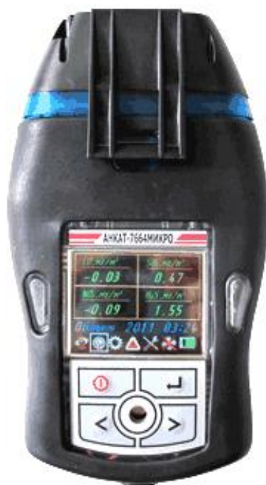
Рис. 2. Газоанализатор «Анкат 7664 Микро-06»

Метод измерения \text{CO}_2 оптоабсорбционный, сероводорода, аммиака, диоксида азота — электрохимический. Газоанализатор по истечении времени прогрева осуществляет непрерывное автоматическое измерение содержания определяемых компонентов, обеспечивает одновременную цифровую индикацию концентрации измеряемых газов на встроенном жидкокристаллическом дисплее с подсветкой. Принцип работы газоанализатора состоит в том, что электрические сигналы, пропорциональные содержанию определяемых компонентов, преобразуются в цифровую форму. Единицей фактической величины является содержание \text{CO}_2 в объемной доле, т. е. в % (от 0 до 20 %). Газоанализатор обеспечивает сохранение в энергонезависимой памяти архива до 500 последних измерений.