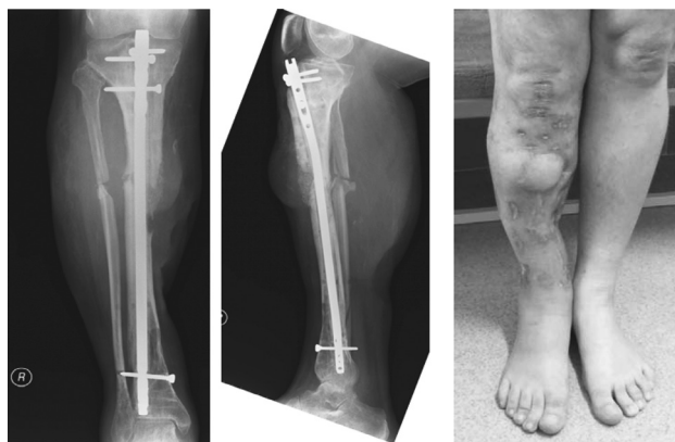
Рисунок 3. Рентгенограммы и внешний вид конечности через 4 месяца после остеосинтеза стержнем с блокированием и антибактериальным покрытием

Таким образом, остеосинтез стержнем с блокированием и антибактериальным покрытием из полиметилметакрилатного костного цемента является эффективным методом лечения пациентов с инфицированными переломами и несращениями длинных трубчатых костей нижних конечностей. В сопоставимых выборках этот метод обеспечивает лучшие функциональные и рентгенологические результаты, чем применение внешней фиксации по Илизарову.