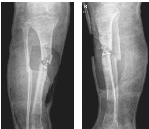
Рисунок 1. Рентгенограммы правой голени при поступлении в клинику

Оперативное лечение: фистулнекрсеквестрэктомия, удаление металлоконструкций из правой голени. Установка спейсера из полиметилметакрилатного цемента в образовавшуюся костную полость, остеосинтез стержневым аппаратом. Посев тканей, взятых во время операции, показал наличие метициллинрезистентного St. Aureus . В послеоперационном периоде развился полнослойный дефект мягких тканей, по поводу которого через 2 недели пациенту была выполнена вторая операция: замена спейсера, пластика дефекта мягких тканей передней поверхности правой голени суральным кожно-фасциальным лоскутом на проксимальном основании (рисунок 2).