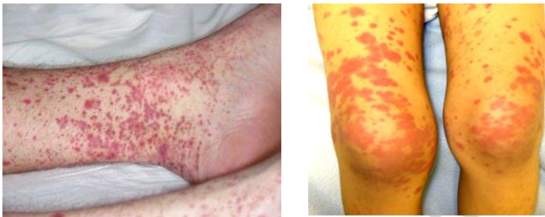
а Рис. 5. Геморрагическая сыпь и отек суставов: а — голеностопного; б — коленных

Поражение почек выражается вторичным нефритом с депозитами IgA, хроническим течением с преобладанием гематурии, протеинурии, возможен исход в хроническую почечную недостаточность. Длительно сохраняющийся мочево́й синдром в случае ликвидации кожных геморрагических проявлений является показанием к проведению биопсии ткани почки для определения морфологических изменений и коррекции дальнейшей терапии.