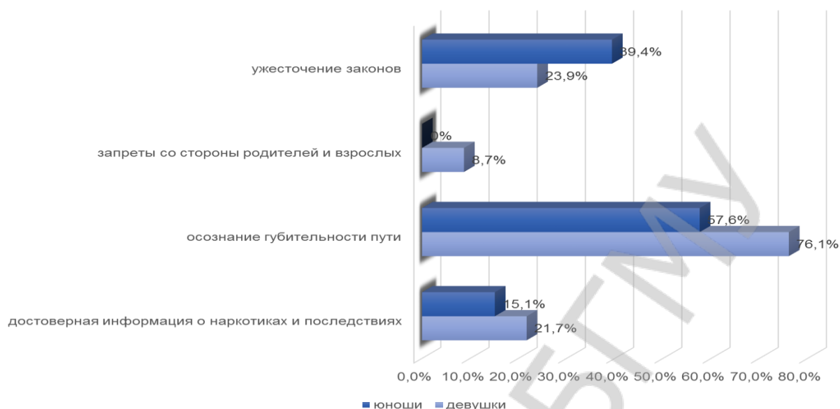
Рисунок 3 – Наиболее действенные меры борьбы с наркотической зависимостью (по мнению респондентов)

Исходя из полученных результатов социологического исследования, профилактика наркозависимости должна носить комплексный характер, в обязательном порядке включая аргументированный воспитательный процесс, направленный на формирование стойкой жизненной позиции, привитие навыков здорового образа жизни и преемственность в профилактической работе семьи, коллектива и общества в целом.