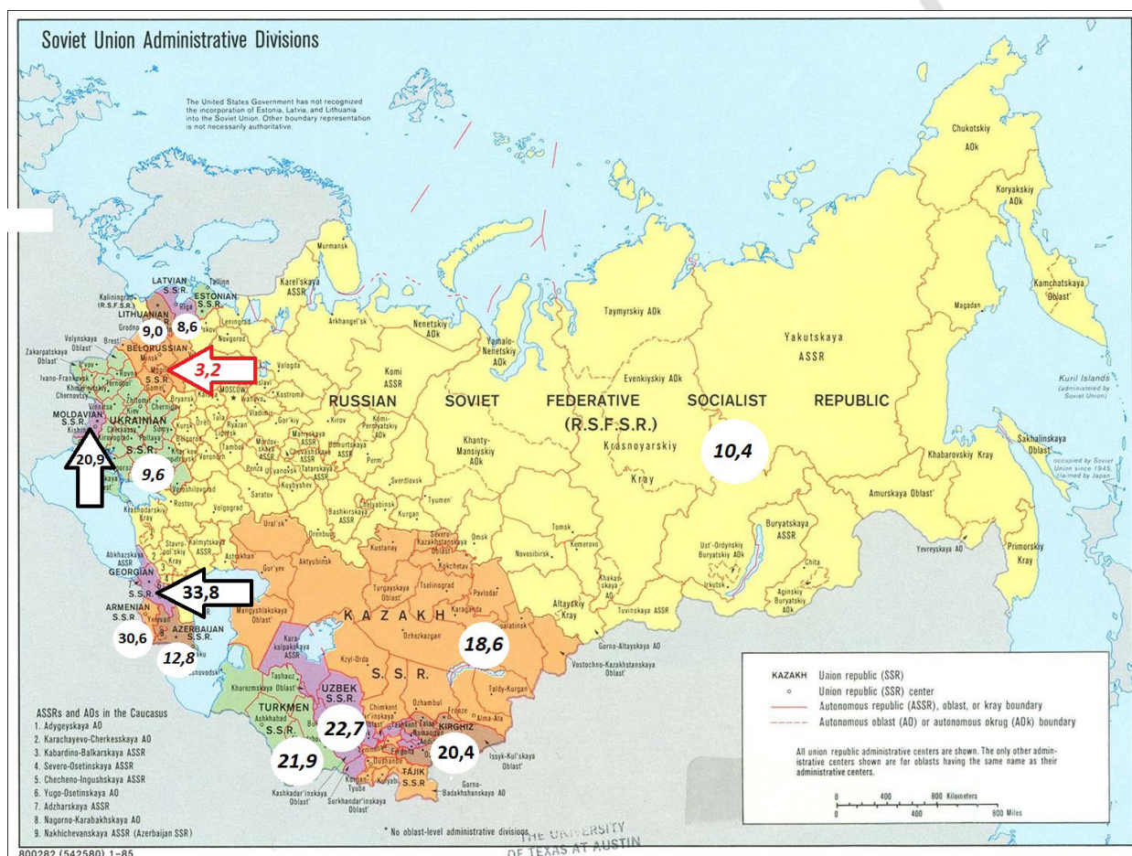
Рис.1 – Заболеваемость всеми формами сифилиса в республиках СССР (на 100 тыс. населения) в 1955 г.

за 1971-2018 гг., статистические материалы о заболеваемости сифилисом в СССР с 1946 по 1961 гг. Центрального научно-исследовательского кожно-венерологического Института МЗ СССР. Для анализа данных использовались методы вариационной статистики.