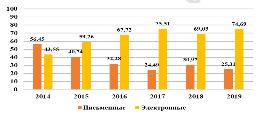
Рис. 2 – Распределение письменных и электронных обращений (в %), поступивших в ЦГиЭ Ленинского района г. Минска в 2014-2019 гг.

При анализе распределения письменных и электронных обращений, поступивших в ЦГиЭ Ленинского района г. Минска в 2014-2019 гг., установлено, что в 2014 г. количество письменных обращений составило 35 (56,45%), электронных – 27 (43,55%); в 2015 г. количество письменных обращений составило 33 (40,74%), электронных – 48 (59,26%); в 2016 г. количество письменных обращений составило 51 (32,28%), электронных – 107 (67,72%); в 2017 г. количество письменных обращений составило 36 (24,49%), электронных – 111 (75,51%); в 2018 г. количество письменных обращений составило 35 (30,97%), электронных – 78 (69,03%); в 2019 г. количество письменных обращений составило 41 (25,31%), электронных – 121 (74,69%) (рисунок 2).