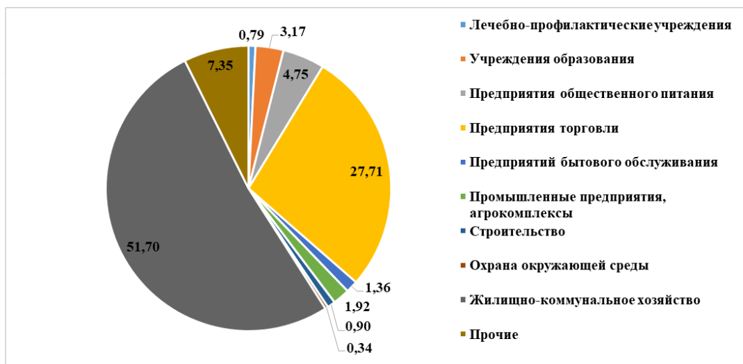
Рис. 4 – Обобщенная структура обращений по вопросам (в %), поступившим в ЦГиЭ Ленинского района г. Минска за 2014-2019 гг.

При анализе обобщенной структуры обращений по рассмотренным вопросам, поступившим в ЦГиЭ Ленинского района г. Минск» в 2014-2019 гг., выявлено, что наибольшее число обращений поступало в связи с неудовлетворительной работой жилищно-коммунального хозяйства – 457 (51,70%), предприятий торговли – 245 (27,71%) и предприятий общественного питания – 42 (4,75%).