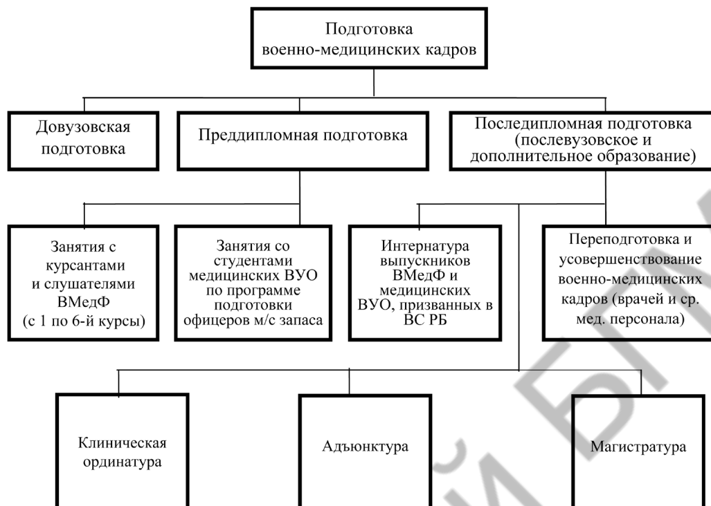
Рис. 1. Подготовка военно-медицинских кадров в Республике Беларусь

цинского образования Российской Федерации, однако менее громоздка и адаптирована к национальной системе образования Республики Беларусь.