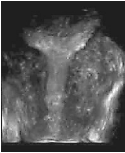
Рис. 4. Аденомиоз (изображение в 3D режиме).

В ходе проспективного исследования мы провели уточнение прогностической ценности таких акустических признаков внутреннего эндометриоза как: увеличение переднезаднего размера матки, округлость её формы, появление в миометрии аномальных кистозных полостей диаметром до 4 – 5 мм накануне менструации (диффузная форма) или образований неправильной формы, без четких контуров и с меньшей эхоплотностью, чем у неизменённой мышечной ткани (узловая форма).