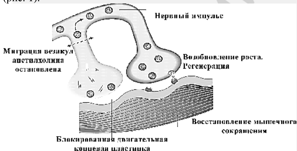
Рис. 1. Механизм действия ботулотоксина.

Ботулинистический нейротоксин является сильнодействующим нервно-паралитическим ядом, который вырабатывается в продуктах анаэробным микроорганизмом Clostridium botulinum . В основе действия препарата лежит нарушение нервно-мышечной передачи, вызванное ингибированием транспорта ацетилхолина к пресинаптической мембране, с развитием пареза или паралича мышцы. При локальном введении в терапевтических дозах БТ не проникает через гематоэнцефалический барьер и не вызывает существенных системных эффектов. Процесс пресинаптического расщепления транспортных белков БТ является необратимым и занимает в среднем 30-60 минут. Несмотря на то, что клеточные эффекты развиваются очень быстро и необратимо, клинически действие препарата проявляется через несколько дней, при СК – на 5-7 сутки. Через 1-2 месяца после инъекции начинается процесс образования новых нервных терминалей от аксонов, где был прежде блокирован транспорт ацетилхолина, с образованием новых функционально активных нервно-мышечных синапсов (так называемый спрутинг). Это приводит к восстановлению мышечных сокращений через 3-6 месяцев после инъекции, и следовательно возвращению клинических симптомов болезни, но иногда длительность эффекта сохраняется до 1 года и более [4,5,9,10] (рис. 1).