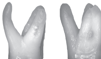
Рис. 3 Первый верхний моляр с прямым небным корнем (справа) и с корнем, изогнутым в щечном направлении (слева)

сти с одним корневым каналом. В настоящем исследовании такой вариант строения обнаружен не был. Рис. 2