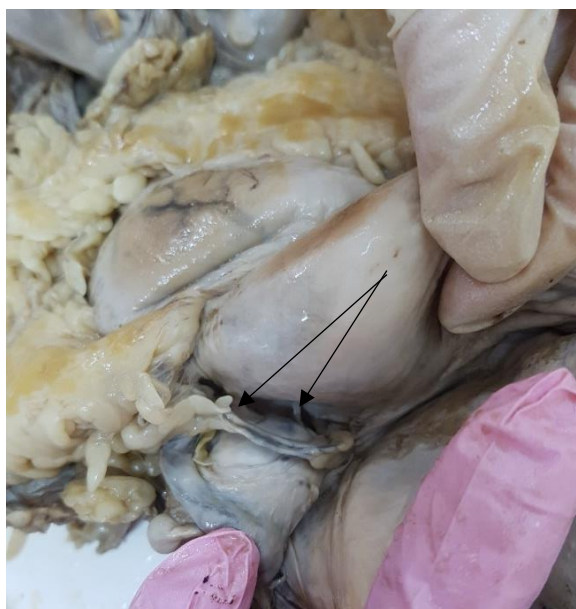
Рис.1. Органоконплекс «мочевой пузырь – матка - прямая кишка» со спайками между маткой и яичником

По боковым краям матки брюшина с передней и задней поверхностей переходит на боковые стенки таза в виде широких связок матки, которые по отношению к матке являются ее брыжейкой. Позади широких связок матки на боковой стенке малого таза выделяют углубления париетальной брюшины, в которых расположены яичники, - яичниковые ямки. На изучаемых нами анатомических препаратах был выявлен случай, когда кроме собственной связки яичника, были обнаружены соединительнотканые тяжи между яичником и маткой, что можно рассматривать как дополнительную предпосылку к возникновению спаек либо патологических очагов (рисунок 1).