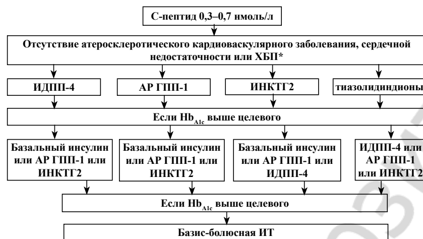
Рис. 2. Алгоритм лечения LADA

При недостижении целевых уровней гликемии могут быть использованы комбинации перечисленных лекарственных средств, и только по исчерпанию всех возможностей иницируется ИТ в базис-болюсном режиме.