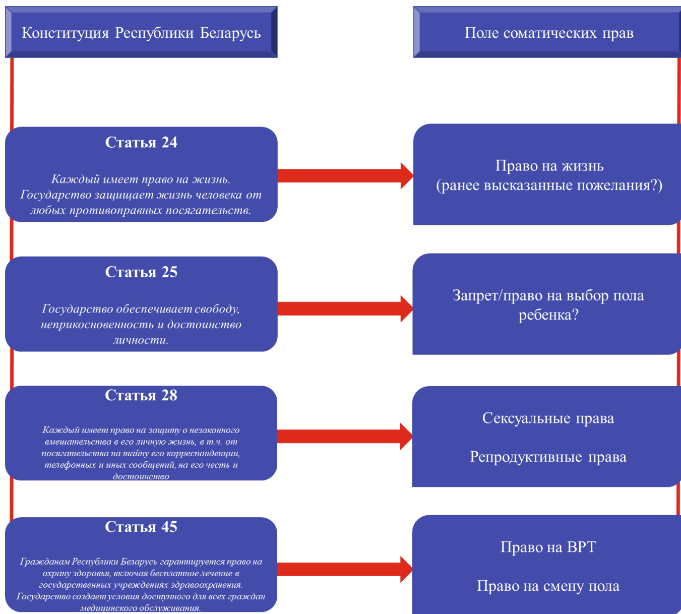
Рис. 3 – Выявленные нами параллели между Конституцией Республики Беларусь и соматическими правами пациента

и органов, применения вспомогательных репродуктивных технологий, реализацию права на аборт, стерилизацию, изменение пола и иные. Все они неразрывно связаны с правами, гарантированными Конституцией Республики Беларусь (рисунок 3) [3].