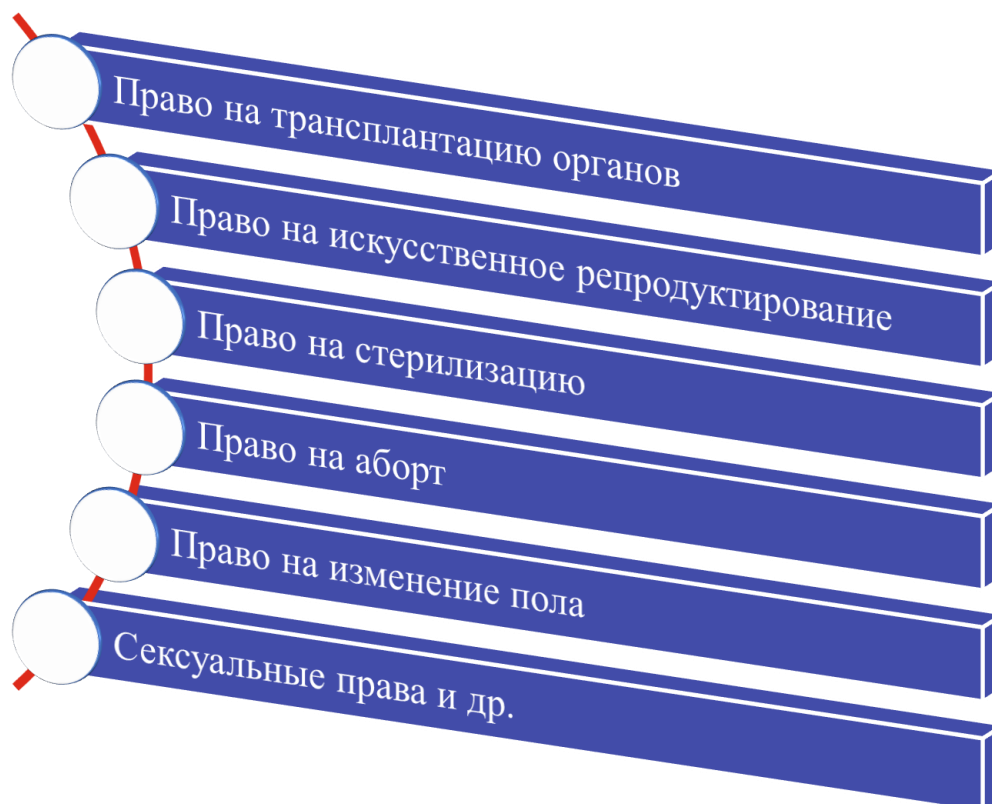
Рис. 2 – Схема некоторых соматических прав пациента

Автономные права пациента затрагивают волеизъявление при действиях, связанных с оказанием медицинской помощи. Соматические же права являются частью естественных прав человека [4]. Они носят сугубо личный характер. Их специфика коррелирует с правом на распоряжение собственным телом. Логически данное волеизъявление должно попадать в правовое поле личных прав. И, действительно, соматические права являются результатом взаимодействия прав пациента в свете научно-технического прогресса, но они являются и принципиально новым классом прав пациента (рисунок 2).