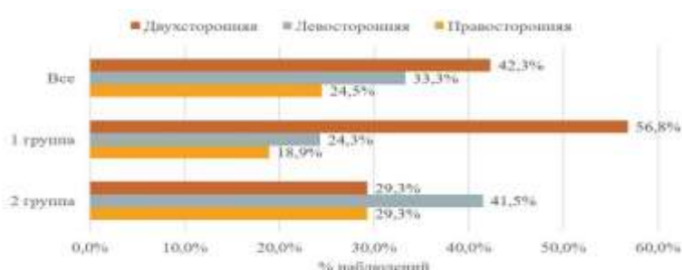
Рис. 3 - Локализация процесса при пневмонии в исследуемых группах.

В 25% случаев инфильтрация носила правосторонний характер, в 33% - левосторонний, а в 42% наблюдалось двухстороннее поражение лёгких, при этом двухсторонний характер преобладал в первой группе пациентов (рис. 3).