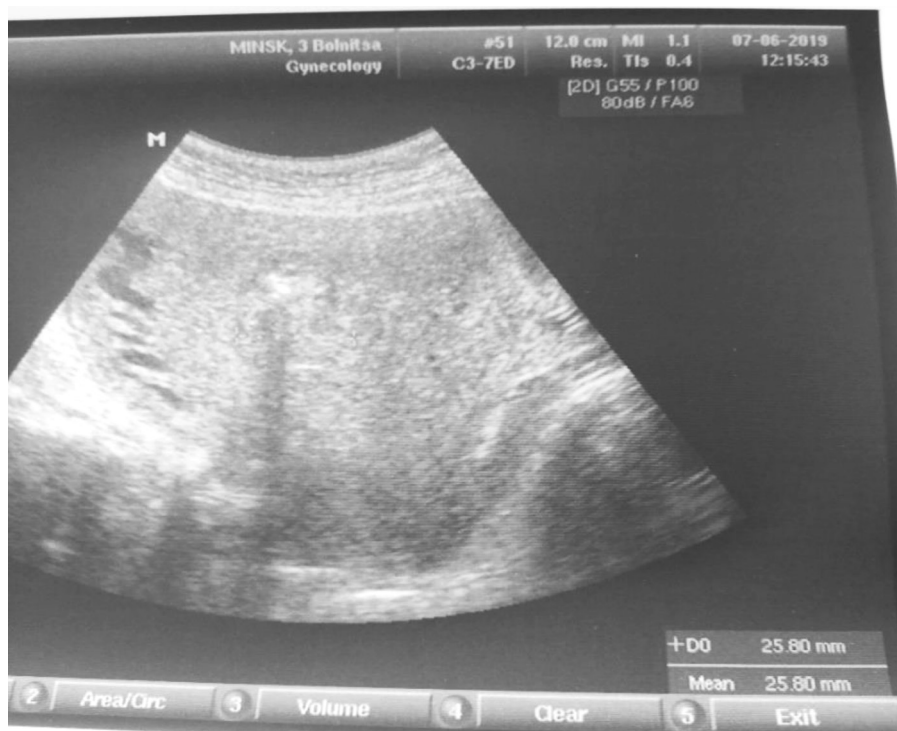
Рисунок 1. Ультразвуковая картина у роженицы с ПСМ (расширение полости до 25,8 мм) на 3-е сутки после родов

сравнения – 3403,2 \pm 344,8 Ед/л ( p = 0,032 ). Так, уровень НоА у рожениц основной группы был снижен по сравнению с параметрами контрольной группы в 1,44 раза ( p = 0,034 ), в группе сравнения – в 1,43 ( p = 0,033 ). Анализ полученных данных свидетельствует о достоверном снижении концентрации медиаторов симпатического и парасимпатического отделов ВНС при нарушении сократительной функции матки. По-видимому, основными причинами формирования застойного геморрагического послеродового экссудата полости матки явились нарушение сократительной функции миометрия, а также значительный рост микробной обсемененности. На рисунках 2 и 3 представлен результат корреляционного анализа взаимосвязи между размером полости матки и уровнем НоА и ХЭ в сыворотке крови у рожениц с ПСМ до лечения.