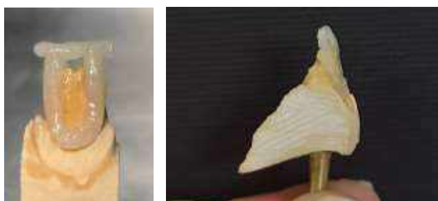
Рис. 3 – Соединение конусов для создания будущего режущего края зуба 1.1

3. Соединение конусов для создания будущего режущего края. Реставрационный материал укладывается в прямую линию, выходя за края конусов с аппроксимальных поверхностей.