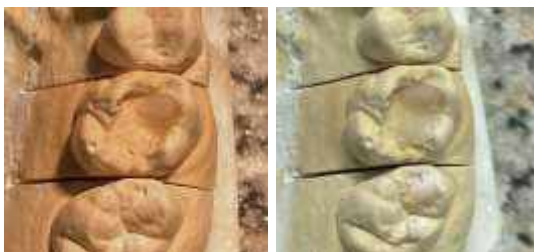
Рис. 7 – Восстановление мезиально-щечного бугорка и восстановление мезиально-нёбного бугорка зуба 2.6

2. Формирование мезиально-язычного бугорка схоже с мезиально-щечным. Перед полимеризацией необходимо сформировать вестибулярную бороздку.