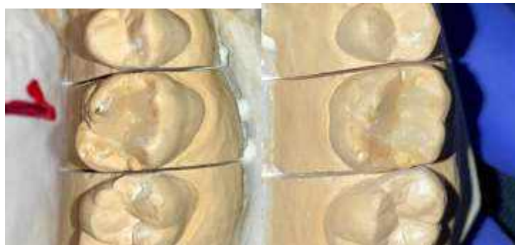
Рис. 9 – Формирование мезиального нёбного бугорка и окончательная детализирование зуба 2.6.

6. В заключение восстановленному зубу требуется придать естественный внешний вид, характеризующийся необходимыми анатомическими структурами