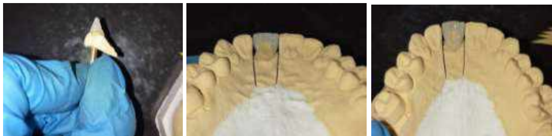
Рис. 6 – Соединение небной поверхности с вестибулярной посредством валиков зуба 1.1 и восстановление фотоотверждаемым композиционным материалом небной поверхности зуба 1.1

Далее корректировка готовой реставрации. Увеличивается толщина валиков и гребешков оральной и вестибулярной поверхностей соответственно.