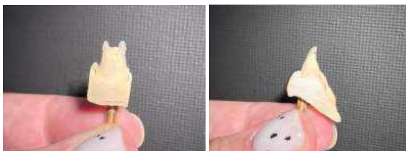
Рис. 1 – Создание конусов на резцовом крае культи зуба 1.1.

1. Создание конусов на резцовом крае культи. Конусы должны быть ниже, чем режущий край зуба-ориентира.