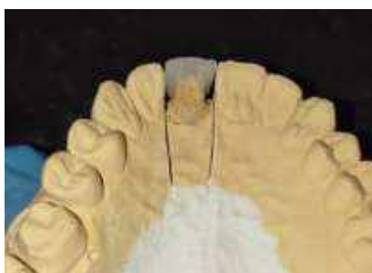
Рис. 5 – Покрытие фотокомпозитом пришеечной области для создания бугорка зуба 1.1.

6. Покрытие фотокомпозиционным материалом пришеечной области для создания будущего бугорка.