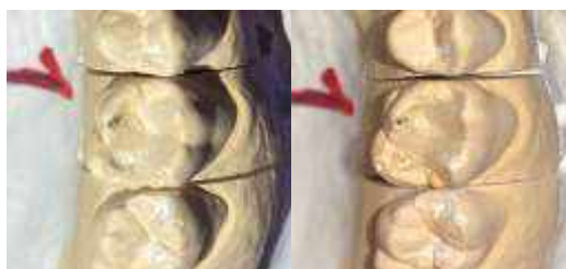
Рис. 8 – Формирование нёбных бугорков и формирование дистального нёбного бугорка и дистальной бороздки зуба 2.6

4. Следующий этап — это дистальный нёбный бугорок и дистальная бороздка.