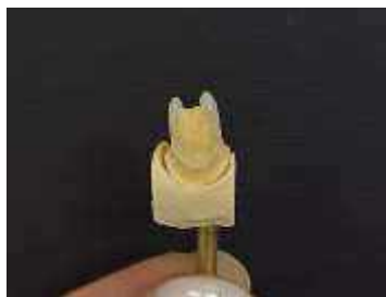
Рис. 2 – Соединение конусов на вестибулярной поверхности зуба 1.1.

3. Соединение конусов для создания будущего режущего края. Реставрационный материал укладывается в прямую линию, выходя за края конусов с аппроксимальных поверхностей.