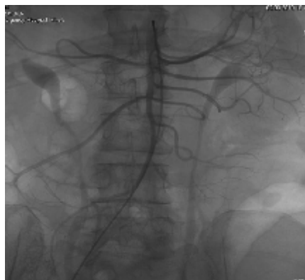
Рисунок 1. Селективная мезентерикография: ангиоспазм ВБА.

Купирование болевого синдрома было отмечено через 15 минут от начала проведения системного тромболитика, наблюдалась нормализация гемодина-