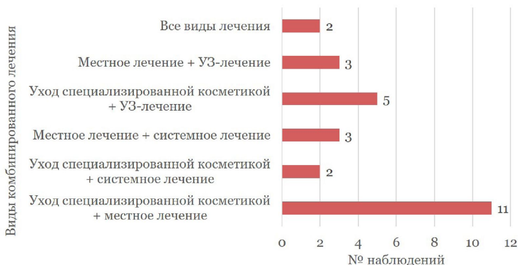
Рис. 6 – Варианты назначенного комбинированного лечения