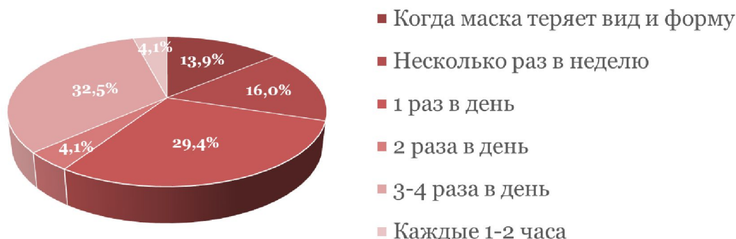
Рис. 3 – Частота замены медицинских одноразовых масок

Из 111 опрошенных, использующих многоразовые тканевые маски, 55 (49,5%) стирают их ежедневно, остальные – по мере загрязнения (рис. 3).