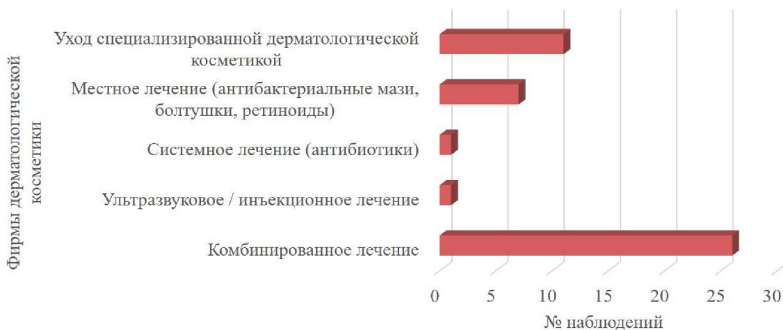
Рис. 5 – Виды лечения, назначенного при обращении к дерматологу по поводу высыпаний

46 участников опроса обращались к дерматологу по поводу высыпаний в пери-оральной области и области подбородка, каждому из них было назначено лечение (рис. 5). В большинстве случаев (56,5%) были назначены комбинации различных видов лечения (рис.6).