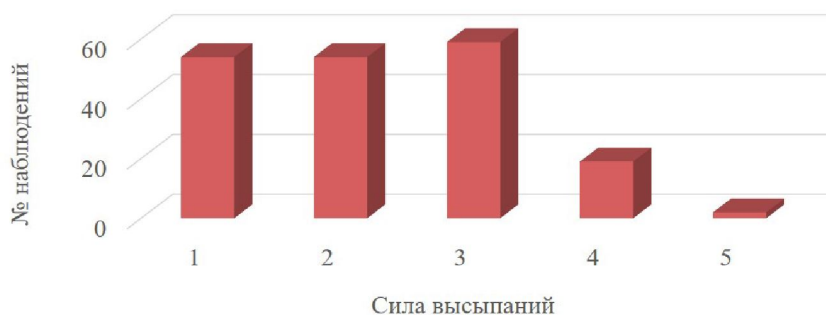
Рис. 2 – Субъективная оценка силы высыпаний

Далее было выявлено, что высыпания на лице постоянно беспокоят 19,5%, часто – 33,5%, редко или совершенно не беспокоят 47% участников. При оценке силы высыпаний по шкале от 1 до 5 большинство (31,4%) выбрали умеренную силу высыпаний (3) (рис. 2).