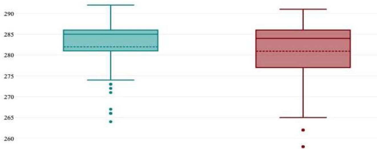
Рис. 2 – Срок начала родоиндукции в 1-й и 2-й исследуемых группах

мощи критерия Манна-Уитни, также не было выявлено достоверных межгрупповых различий: в первой группе средний срок гестации на момент начала родоиндукции составил 285 [281;286] дней, во второй группе – 284 [277;286] дней (рисунок 2).