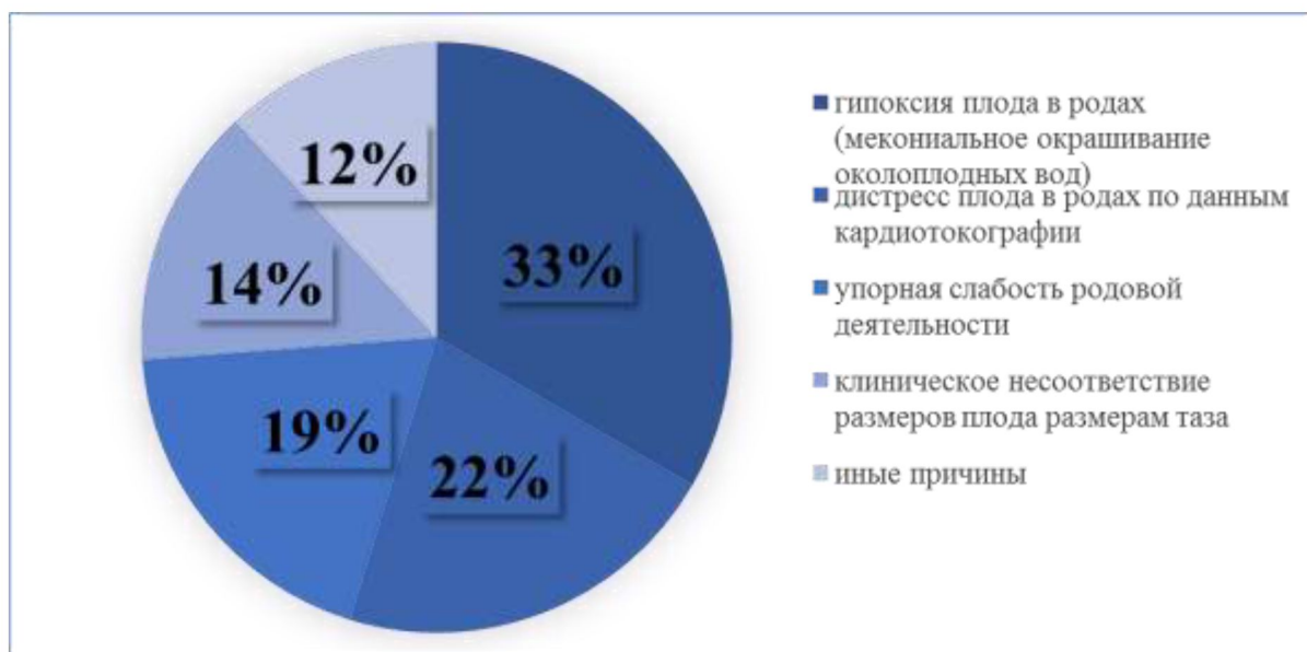
Рис.3 – Показания для экстренного КС

Основными показаниями к проведению операции кесарева сечения являлись: клинические признаки гипоксии плода в родах (мекониальное окрашивание околоплодных вод) – 33,33%; дистресс плода в родах по данным кардиотокографии – 21,42%; упорная слабость родовой деятельности, не поддающаяся медикаментозной коррекции – 19,04%; клиническое несоответствие размеров плода размерам таза – 14,28%; иные причины – 11,92% (рисунок 3).