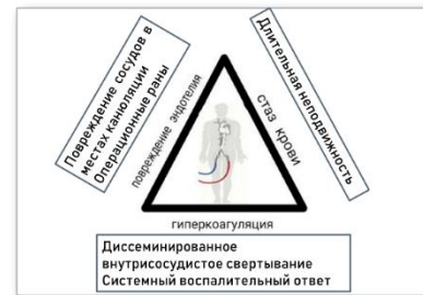
Рис. 5 – Триада Вирхова в отношении пациента

Пациент поступил в отделение кардиохирургии для проведения оперативного вмешательства по поводу основного заболевания. ИБС: постинфарктный и атеросклеротический кардиосклероз. Атеросклероз аорты, стенозирующий коронарных артерий. Стеноз аортального клапана (S 0.7 см 2 ). Недостаточность митрального клапана с регургитацией второй степени. Недостаточность трикуспидального клапана с регургитацией третьей степени.