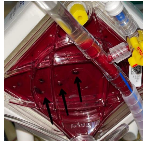
Рис. 2 – Нити фибрина в оксигенаторе

При проведении ЭКМО для пациентов, находящихся в критическом состоянии, создаются условия формирования уникального гемостазиологического статуса, сочетающего влияния как прокоагулянтных, так и антикоагулянтных факторов.