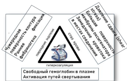
Рис. 4 – Триада Вирхова в отношении контура ЭКМО

Важно учитывать, что различные факторы могут способствовать активации системы свёртывания. Протромботические изменения можно описать при помощи триады Вирхова в отношении контура ЭКМО и организма пациента.