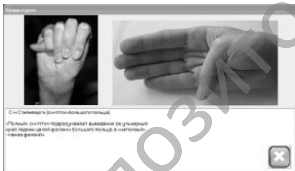
Рисунок 10. Комментарии к признаку «Полный симптом большого пальца»