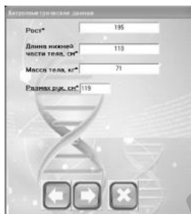
Рисунок 8. Диалоговое окно для ввода результатов антропометрии