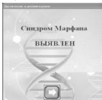
Рисунок 12. Диалоговое окно «Заключения и рекомендации»