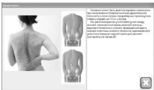
Рисунок 9. Комментарии к признаку «Сколиотическая деформация позвоночника»