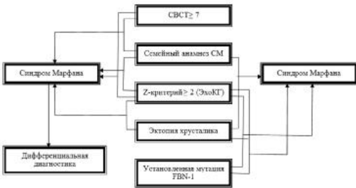
Рисунок 2. Алгоритм, лежащий в основе АИС диагностики СМ

Примечание: за увеличение размера аорты принято значение Z критерия \geq 2 для пациентов в возрасте старше 20 лет и Z \geq 3 для пациентов моложе 20 лет; при дифференциальной диагностике необходимо исключить синдромы Шпринцена-Гольдберга, Луиса-Дитца и Элерса — Данло сосудистого типа, а также провести генетическое тестирование рецепторов TGFB1/2, генов коллагенов COL1A1, COL3A2, COL3A1 и др.