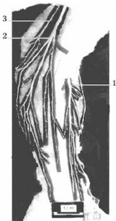
Рис. 2. Кожные нервы плечевого сплетения передней поверхности верхней конечности слева. Синдром Дауна, новорожденный мужского пола, фото с препарата № 108.

1- латеральный кожный нерв предплечья; 2- медиальный кожный нерв предплечья; 3- медиальный кожный нерв плеча