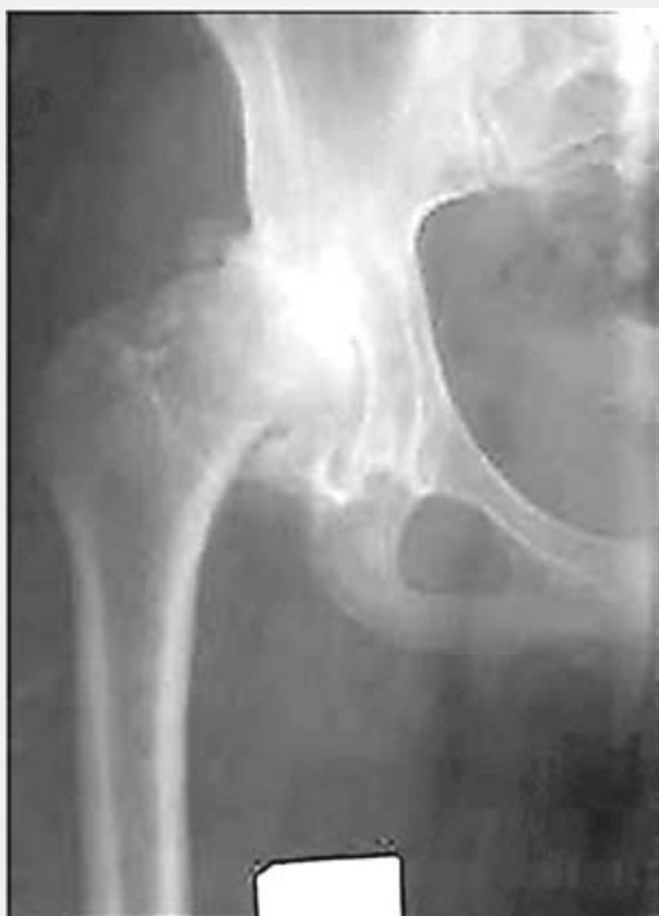
Рис.3. Б-ная К., 29 лет, женщина.

Неудовлетворительный результат у 4 (16,7%) обусловлен активным прогрессированием процесса сопровождающимся значительным поражением сустава, выраженным болевым синдромом и потерей функции.