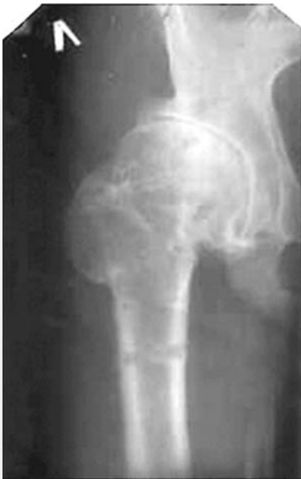
Рис.4.Через 10 лет. Состояние удовлетворительное. Жалоб нет. Объём движений в суставе:

разг./сгиб. 0/10/80; отв./прив. 15/0/15; ротац. нар./ротац. внутр. 5/0/5.