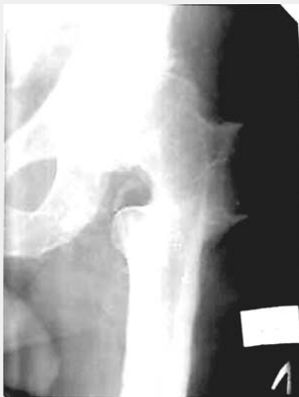
Рис.2. Через 5 лет. Жалоб нет. Ходит с полной нагрузкой на ногу. Объем движений в суставе:

Выполнена межвертельная вальгизирующе-медиализирующая остеотомия