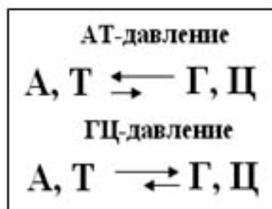
Рисунок 1. Схема направлений мутационного давления

Мутационное давление – это фактор молекулярной эволюции, дающий материал для естественного отбора и обусловленный повышенной частотой возникновения и фиксации замен А и Т на Г и Ц относительно частоты возникновения и фиксации замен Г и Ц на А и Т (ГЦ-давление), или наоборот (АТ-давление, рис. 1) [9].