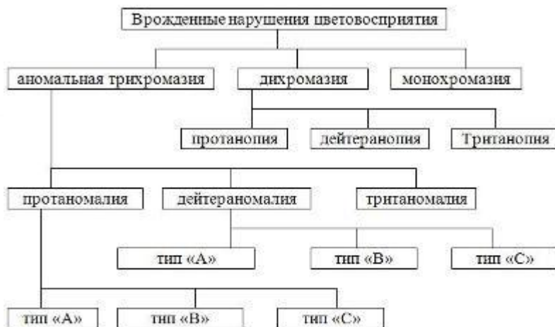
Схема 2: Классификация врожденных нарушений цветовосприятия по Крису-Нагелю-Рабкину.

В классификации Криса-Нагеля-Рабкина выделена аномальная трихромазия, которая подразделяется на три формы: