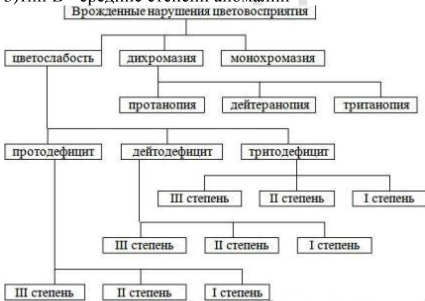
Схема 3: Классификация врожденных нарушений цветовосприятия по Ньюбергу-Раутиану-Юстовой.

В классификации цветовых расстройств по Ньюбергу-Раутиану-Юстовой сохранилось понятие «дихромазии» и ее видов. Вместо понятия «аномальная трихромазия» введено понятие «цветослабость». Согласно данной классификации она разделена на три вида: