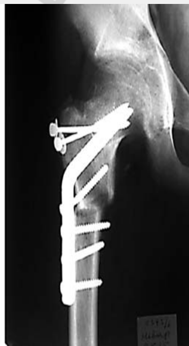
Рис. 7. Р-гр. с отведением и внутренней ротацией (16.11.2000)