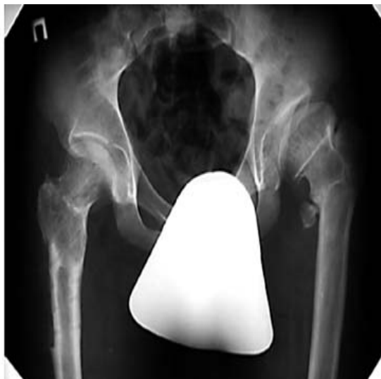
Рис. 10. 6 мес. после ДВалОБ справа