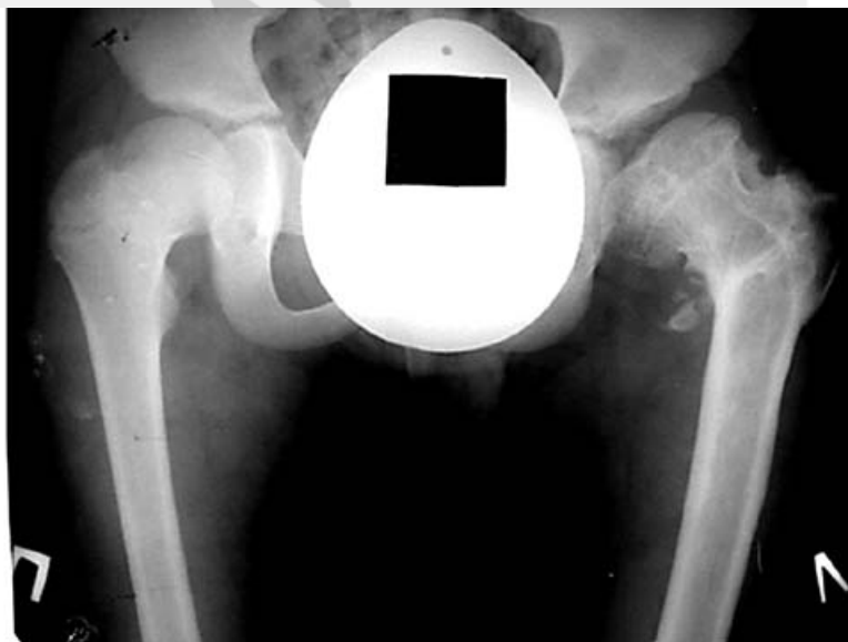
Рис. 3. Р-гр. во время операции (15.02.1995)