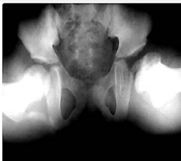
Рис. 1. Р-гр. при поступлении (9.01.1995)