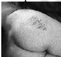
Рис. 2. Заживление послеоперационной раны

При вскрытии гнойника с наложением первичного шва, дренированием и вакуум аспирацией содержимого были получены следующие послеоперационные результаты: Первичное заживление ран в 62,9% случаев (34 человека). Средний срок пребывания больных в стационаре, у которых был применен метод вскрытия гнойника с наложением первичного шва, составил 9,13 \pm 0,09 суток. Не имелось грубых послеоперационных рубцов в области ягодиц (см. рисунок 2).