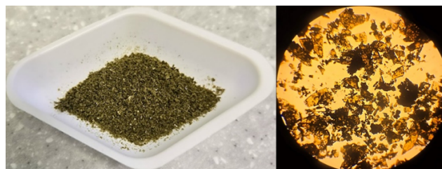
Рис. 3 – Внешний вид и структура частиц сухого экстракта полыни горькой, полученного методом реперколяции

По показателю «Внешний вид» сухой экстракт полыни горькой, полученный методом реперколяции, представляет собой зеленовато-коричневый порошок со специфическим ароматным запахом горького вкуса с вкраплениями частиц темно-зеленого или темно-коричневого цвета. Морфологический анализ сухого экстракта, выполненный с помощью микроскопии, позволяет классифицировать его как полидисперсную систему. В структуре идентифицированы частицы трех основных типоформ: пластины, параллелепипеды и овалы, для которых типична шероховатая поверхность и неровные границы. Внешний вид и структура частиц полученного экстракта представлены на рисунке 3.