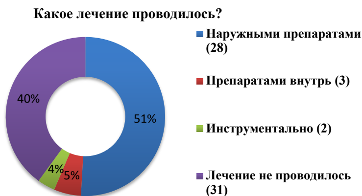
Рис. 2 – Лечение вульгарных угрей

В последующем 32 интервьюера (50%) не обращались к специалистам. Ответ на вопрос какое лечение проводилось ответы представлены в Рисунке 2.