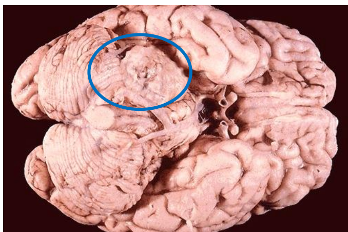
Рисунок 3. – Макроскопическое строение опухоли

Макроскопически опухоль имела вид образования округлой или неправильной формы с бугристой поверхностью, окруженного капсулой (рисунок 3), [2].