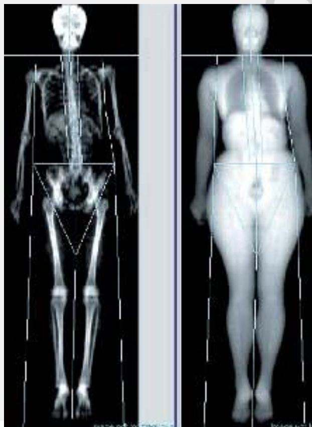
Рис. 4. Программа «все тело».

Нельзя не упомянуть, о возможностях современных денситометров определять содержание МПКТ во всем скелете, а также отдельно исследовать плотность жировой ткани и мышечной массы. Данными возможностями обладают двухэнергетические рентгеновские денситометры, оснащенные программой «все тело» (рис.4) и являющиеся пионерами в данной области исследований [2].