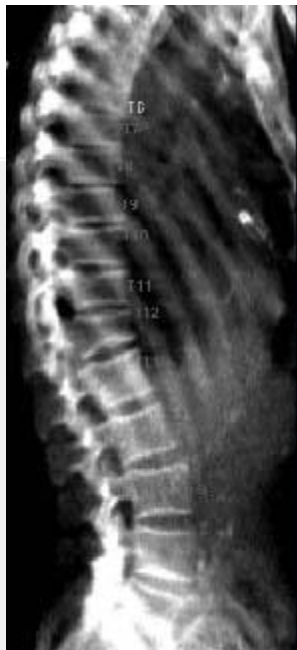
Рис. 2. Горизонтальная латеральная ДРА позвоночника.

ДРА грудного отдела позвоночника не проводится, так как грудина и ребра являются помехой для измерения МПКТ.