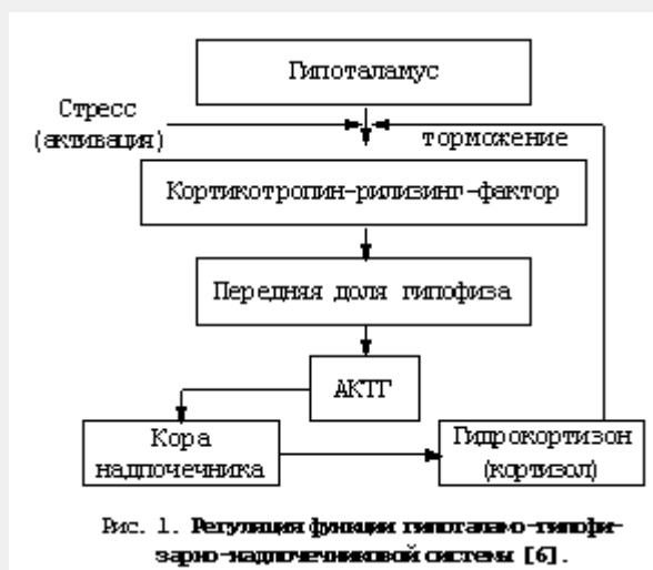
Вис. 1. Регуляция функции гипоталамо-гипофизарно-надпочечниковой системы [6].

В зависимости от силы воздействия, оцениваемой в основном по выраженности сосудосуживающего эффекта, каждый локальный ГКСГ может быть отнесен к одному из следующих классов: 1) слабый, 2) умеренно сильный, 3) сильный, 4) очень сильный (см. Таблицу 1) [4]. Основным критерий распределения препаратов по данной классификации – их химический состав. Подобные классификации, основанные на делении всех локальных ГКС на четыре класса, приняты в большинстве стран Европы, США [7, 9].