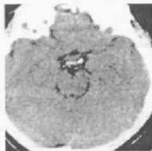
Рис.8. Данные компьютерной томографии больного М., 52 г. после проведения оперативного лечения

анамнеза: считает себя больным с 1992г., когда появилось ухудшение зрения на оба глаза. С марта 1999г. отмечает сужение полей зрения справа. Неврологический статус: состояние удовлетворительное, сознание ясное, ориентирован, адекватен, на вопросы отвечает правильно. Очаговой неврологической симптоматики нет. Оценка качества жизни по шкале Карновского 90 баллов. Соматической патологии не выявлено. КТ головного мозга от 10.06.99. Объемное образование sellarной и parasellarной области (вероятно аденома гипофиза) (рис.1). 16.06.99 Каротидная ангиография справа: приподнят сегмент А1(рис.2,3).