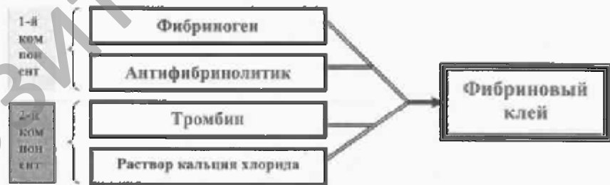
Схема 1. Состав препарата «Фибриностат».

Прочность фибринового сгустка определяется количеством применяемого фибриногена. Тромбин в основном оказывает влияние на скорость образования сгустка. Формирование геля менее чем за 5 секунд отмечается при концентрации тромбина 500 ЕД, тогда как при концентрации 4 ЕД необходимо от 30 секунд до нескольких минут. Увеличе-