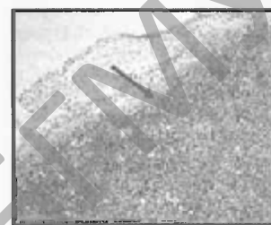
Рис.5. В фиброзной ткани видны многочисленные коллагеновые волокна. 21-е сутки применения «Фбриноста». Окраска MSB. Ув. 90