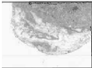
Рис.1. Зона травматического повреждения с некрозом ткани селезёнки. 1-е сутки применения «Фибриноста». Окраска гематоксилином и зозином. Ув.45