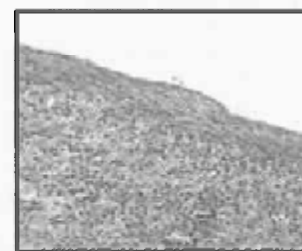
Рис.6.Очаговое утолщение и фиброз капсулы селезёнки на месте повреждения. 28-е сутки применения «Фбриноста». Окраска гематоксилином и зозином. Ув.175