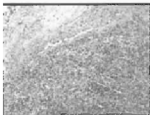
Рис.2. Появление фибробластов и макрофагов в пограничной зоне. 3-и сутки применения «Фбриноста». Окраска гематоксилином и зозином. Ув.175