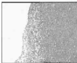
Рис.3. Утолщение капсулы селезёнки в области формирующегося рубца. 7-е сутки применения «Фбриноста». Окраска MSB. Ув.175

наркозом (реланиум 0,5 мг/кг и калипсол 3мг/кг). Крысам выполнялась верхнесрединная лапаротомия, в рану выводилась селезенка. После чего выполняли стандартную краевую резекцию селезенки размером 10 x 5 мм. В основной группе на кровоточащую поверхность послойно наносился препарат до окончательной остановки кровотечения. Через 15 мин после остановки кровотечения операционная рана ушивалась наглухо и животные выводились из наркоза.