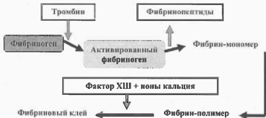
Схема 2. Схема фибринообразования