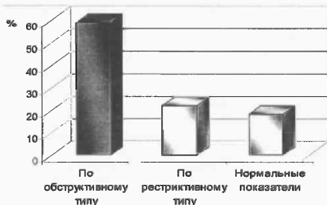
Рис. 4. Результаты исследования ФВД до лечения

фекционно-токсический миокардит и инфекционно-токсическая нефропатия – 0,9% случаев.