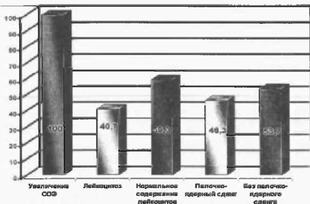
Рис. 3. Результаты исследования основных показателей крови у больных внебольничной пневмонией (n=54)