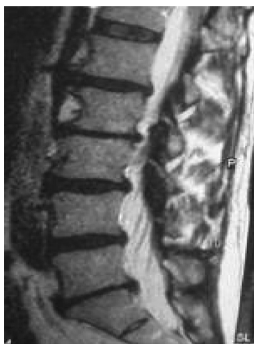
Рис. 2. МРТ центрального стеноза на уровне 1–3 поясничных позвонков

срезы делает этот метод особенно информативным (рис. 2) [4].