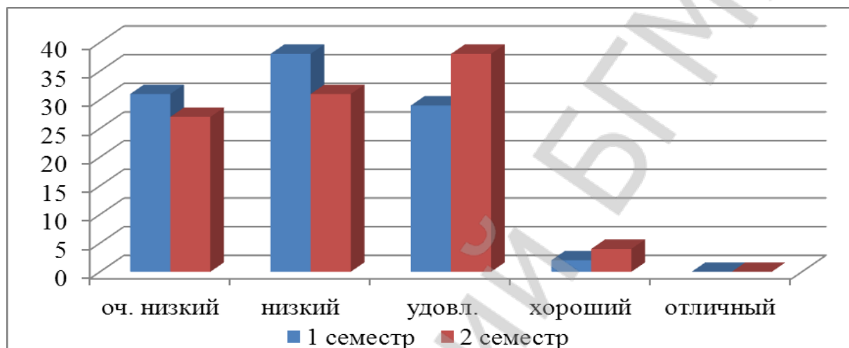
Рисунок 2 - Распределение девушек БГМУ по уровням физического здоровья

У девушек распределение по уровням физического здоровья в процентном отношении произошло следующим образом (рисунок 2). В начале учебного года очень низкий УФЗ был выявлен у 31%, низкий - 38%, удовлетворительный – 29%, хороший - 2%, отличный уровень не выявлен. В конце учебного года очень низкий УФЗ был выявлен у 27%, низкий - 31%, удовлетворительный – 38%, хороший – 4%, отличный уровень не выявлен.