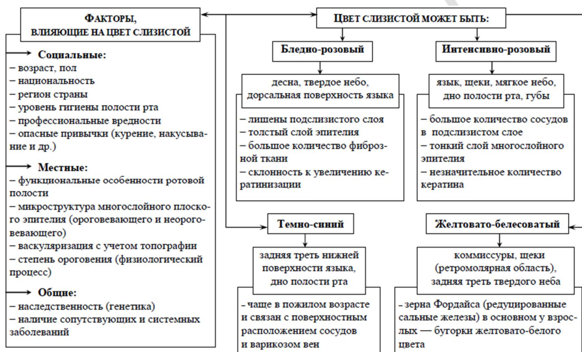
Схема 1 – Цвет СОПР в норме по топографическим зонам

Таким образом, при обследовании каждого пациента на этапе осмотра, в первую очередь следует оценивать состояние мягких тканей по таким клиническим критериям, как цвет и рельеф (поверхность) слизистой оболочки полости рта и в целом ее архитектонику в норме и для распознавания патологических процессов [2, 3].