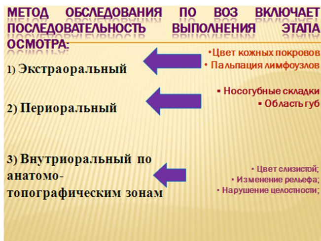
Рис. 1- Алгоритм обследования по ВОЗ

метода обследования по ВОЗ позволяет не только обзорно оценить состояние всех тканей полости рта, но и выявить ранние признаки заболеваний слизистой, болезней пародонта и т.д. [2, 5]. Важно распознать патологию слизистой и провести оценку пораженных участков по таким клиническим критериям, как изменение цвета, рельефа, нарушение целостности, их локализацию и т. д. в сопоставлении с нормальными окружающими тканями [6, 7].