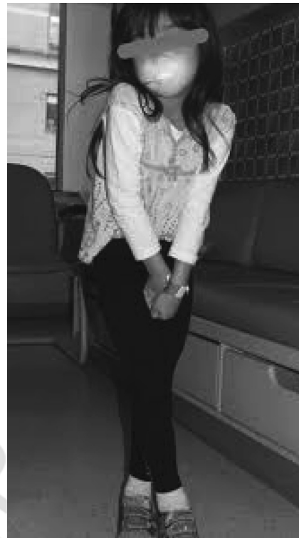
Рис. 2. «Удерживающая» поза ребенка

Ректальное исследование подтверждает нормальный тонус ануса при сильно увеличенной и заполнен-