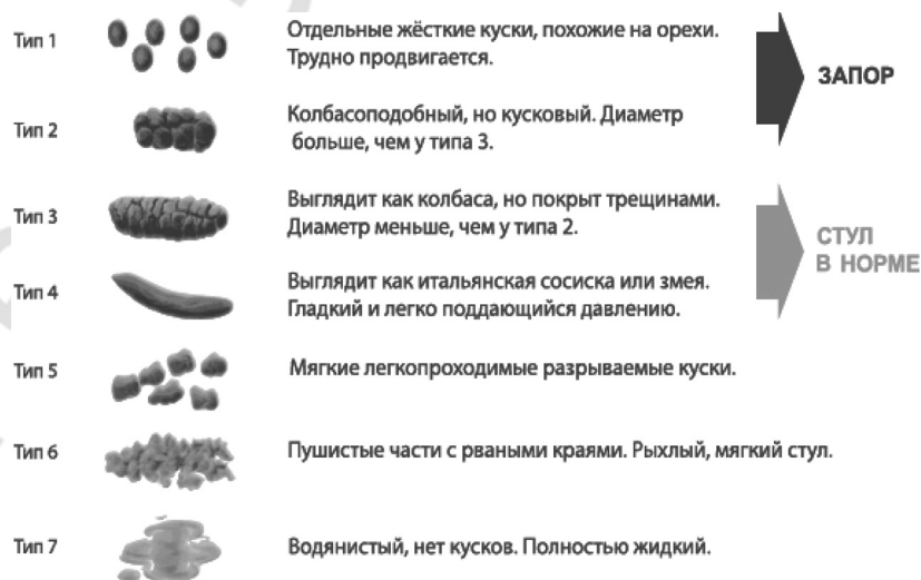
Рис. 4. Бристольская шкала формы кала

Геморрой – явный признак и следствие запора, крайне редко встречается у детей, даже при его длительном течении. При длительном периоде прохождения больших объемов стула и анальных трещинах можно увидеть сформированную анальную складку (сторожевой бугорок) – следствие хронической аналь-