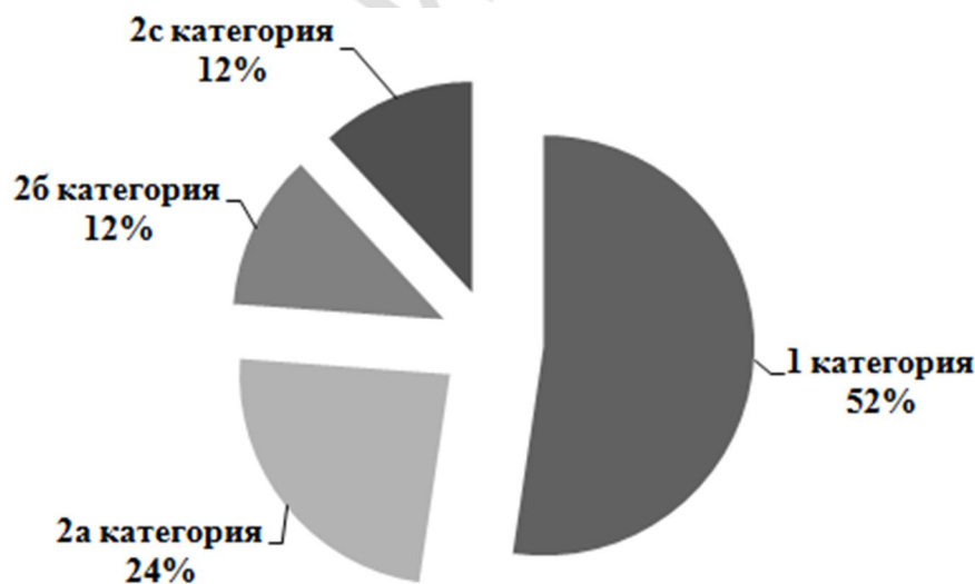
Рис. 2 – Категории АФС, встречающиеся в исследуемых клинических случаях

В 9 ГКБ при установлении диагноза АФС, пользуются следующей классификацией этого синдрома: АФС 1 категории – более 1 лабораторного показателя; АФС 2а категории – имеется только ВА ( волчаночный антикоагулянт); АФС 2б категории – имеется только аКЛ ( антикардиолипин); АФС 2с категории – имеется только антиβ2 –гликопротеин. На рисунке 2 представлены категории АФС, встречающиеся в клинических случаях. На рисунке 3 представлены категории АФС, в случаях с неврологическими проявлениями.