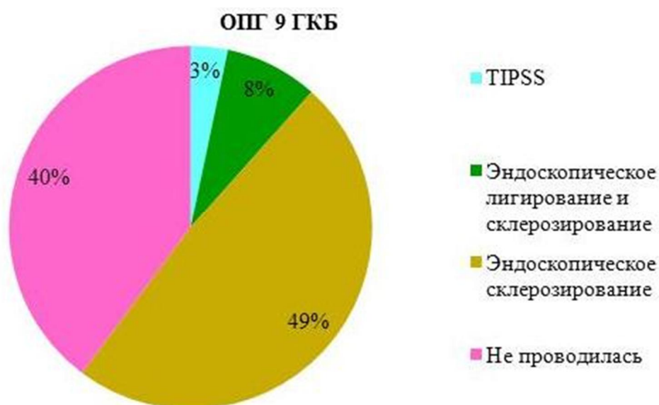
Рис. 1- Структуру проводимых вмешательств с целью профилактики рецидивов кровотечения у пациентов, поступивших с состоявшимся кровотечением.

У части пациентов с состоявшимся кровотечением (n=107 (57 %)) в ОПГ 9 ГКБ проводилось хирургическое лечение на спавшихся венах в отсроченном порядке.