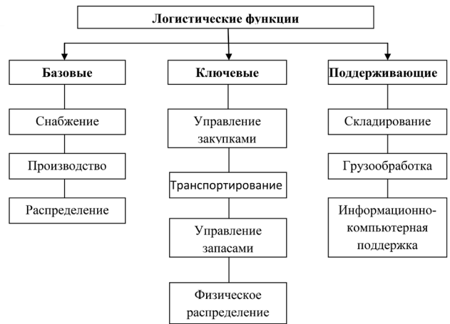
Рис. 1. Функции логистической системы

Важной для достижения экономической эффективности при организации и предоставлении ЭМП пострадавшим в ЧС является логистика запасов («резервов»).