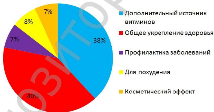
Рисунок 2–Цель покупки респондентами БАД

Частота приобретения БАД невысока – только 1,7% опрошенных приобретают их постоянно, 55,9% редко или при необходимости, а 42,4% вообще никогда этого не делали. Основной мотивацией для покупки биологически активных добавок стала консультация врача (29%), 22% процента опрошенных приобретали их по совету знакомых, остальная часть – под влиянием различных СМИ и по предложению распространителей. Основная цель приобретения – общее укрепление здоровья (Рисунок 2).